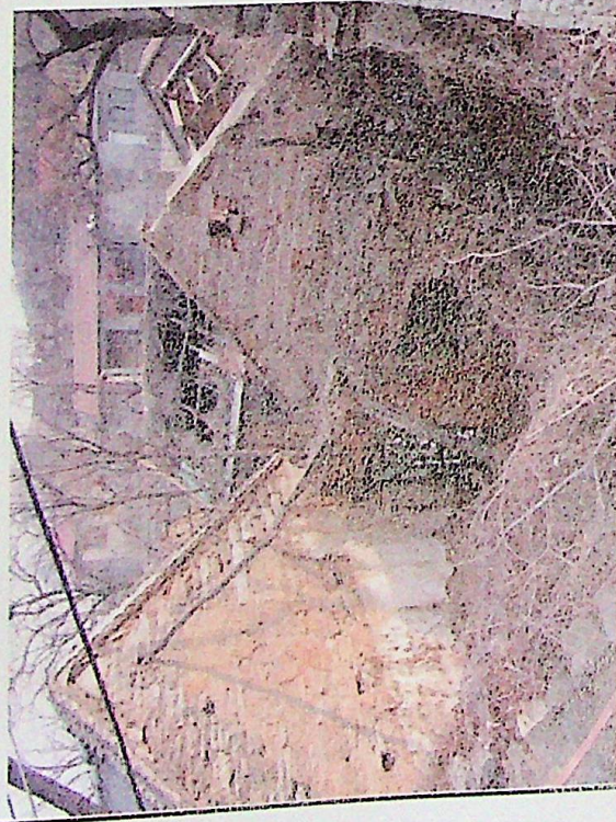
建筑院落整治详图