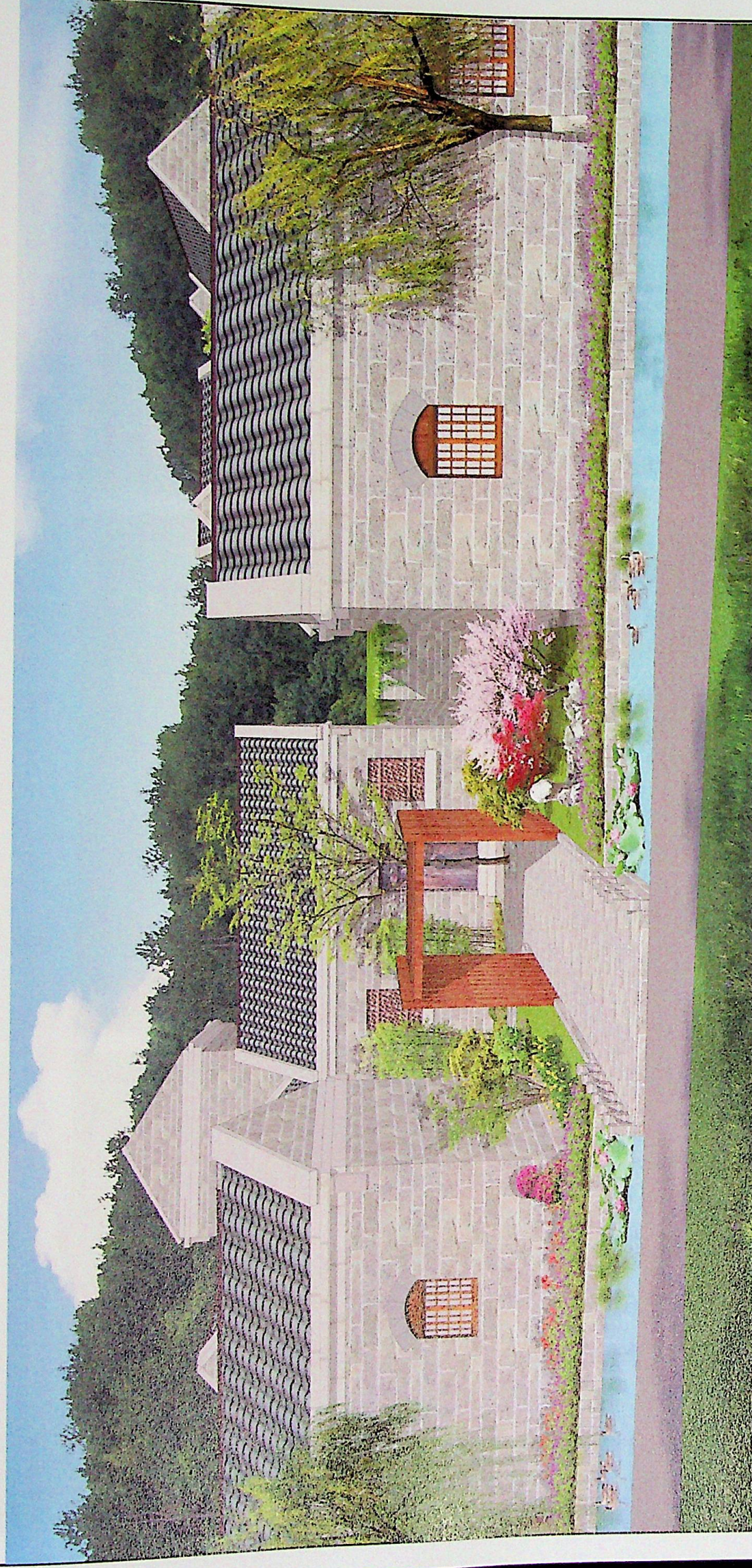
建筑院落整治详图