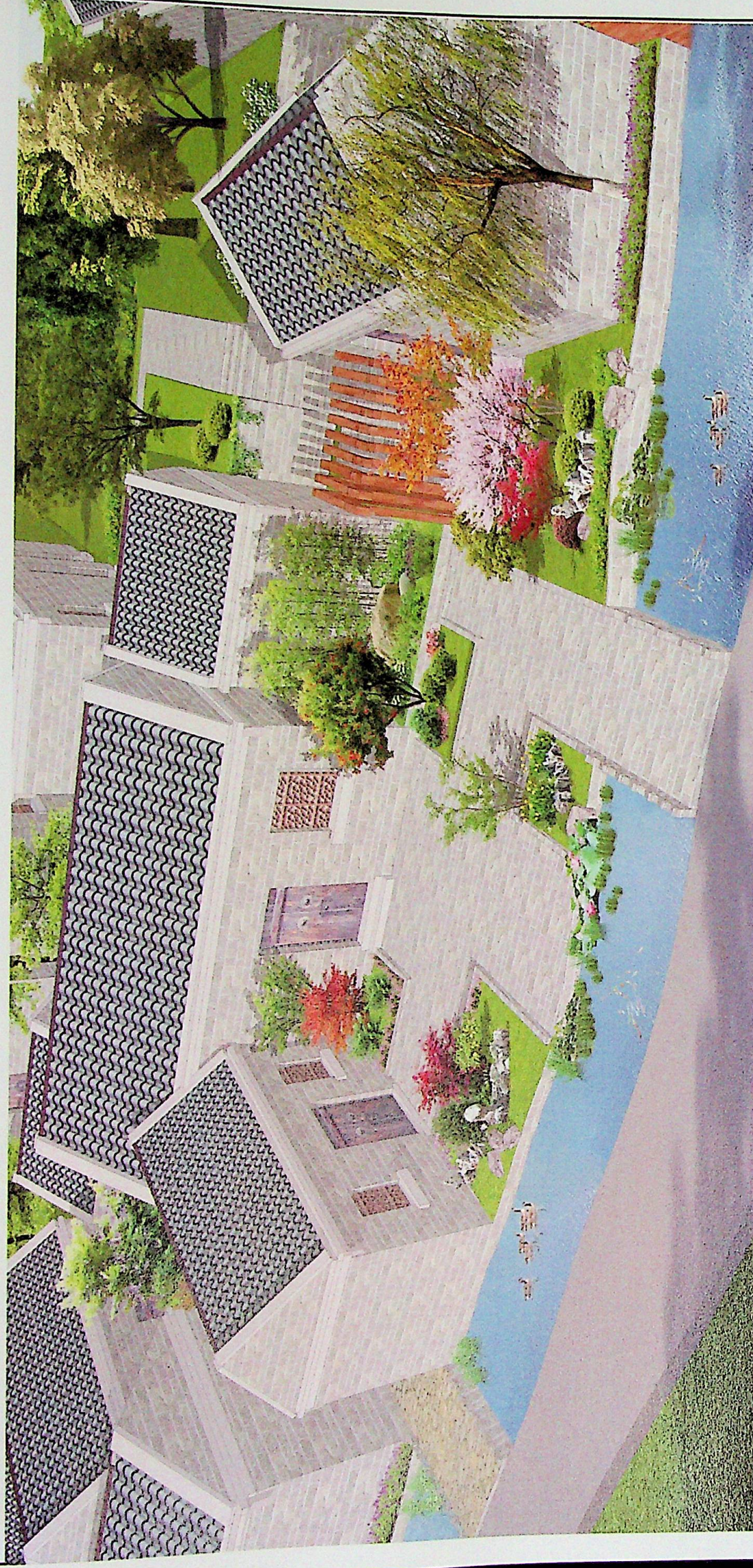
建筑院落整治详图