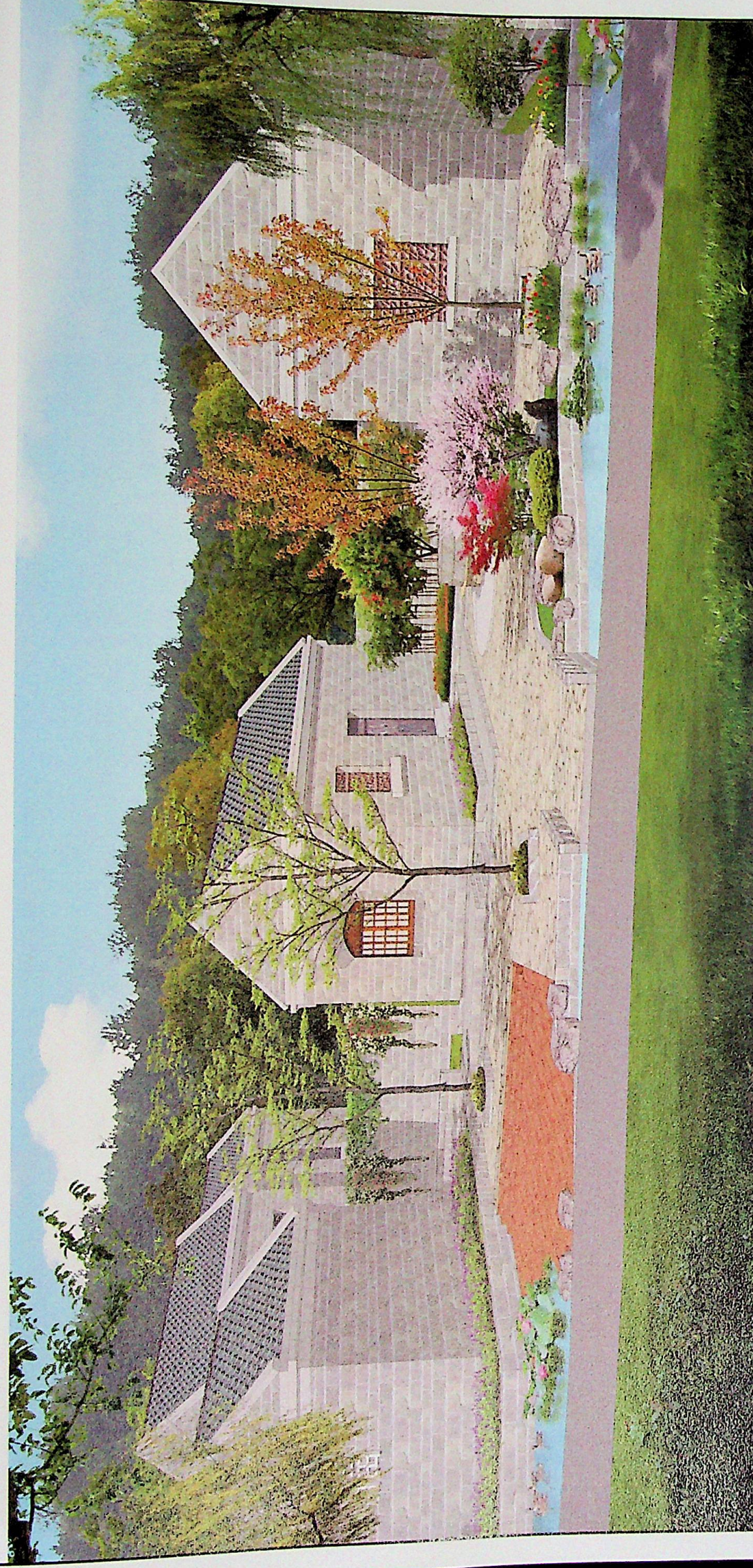
建筑院落整治详图