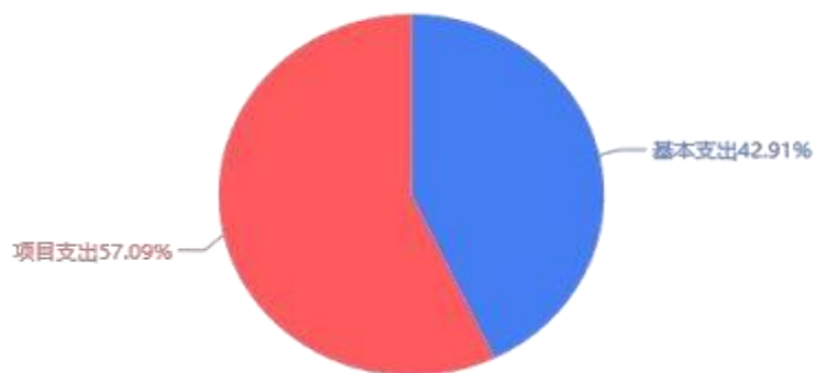
图3：本年支出构成情况