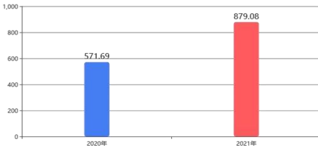
图4：财政拨款收、支决算总计变动情况 (单位：万元)