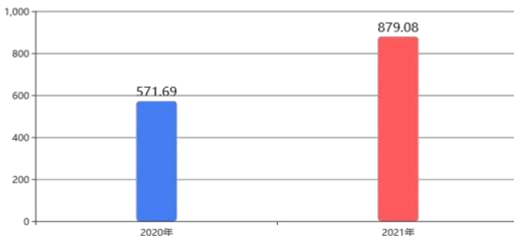
图5：一般公共预算财政拨款支出决算变动情况 (单位：万元)

2021年度一般公共预算财政拨款支出879.08万元，占本年支出合计的100.00%。与2020年相比，一般公共预算财政拨款支出增加307.39万元，增长53.77%。主要是机构改革，业务划转导致行政审批业务增加，人员增加。